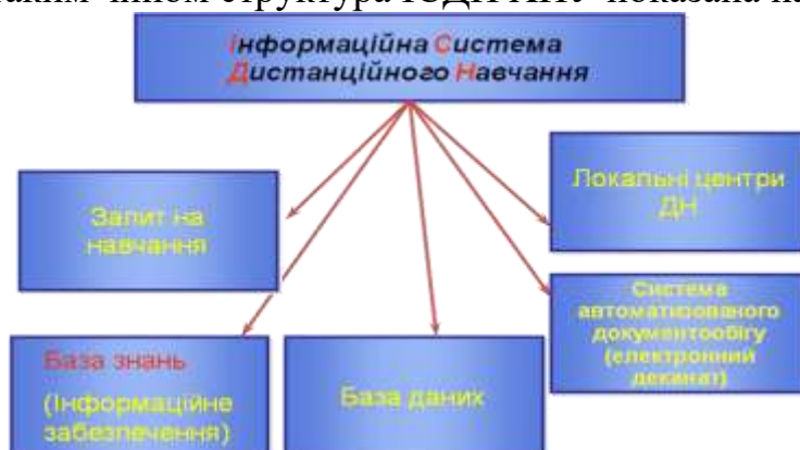
Рис.1 - Структура інформаційної системи ДН ХНУ

Інформаційна система ДН (ІСДН) має дати можливість абітурієнту із будь-якої точки світу ознайомитись із відкритими (рекламними) матеріалами, записатись на одержання потрібного ОКР за вибраною спеціальністю (напрямом), і після оформлення договірних документів, бути зарахованим до ВНЗ, одержати доступ до всіх необхідних матеріалів для реалізації навчального процесу. Цей процес має бути керованим і документально забезпеченим. Крім того студент має одержувати консультації і допомогу як з боку центрального ВНЗ, так і за місцем проживання, де проходить його процес навчання. Розроблена таким чином структура ІСДН ХНУ показана на рис. 1.