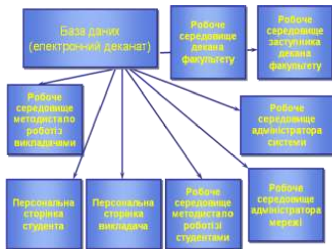
Рис. 5 – Структура бази даних і електронного деканату ІСДН

Існуючі системи ДН передбачають запис студента на вивчення курсу конкретного викладача-тьютора. Тому взаємодія між ними проходить на рівні викладач-студент, що не зовсім відповідає практиці вищої школи України. Як правило, функції керування навчальним процесом на рівні навчального плану має покладатися на деканат, що містить у своїй структурі: методистів, які безпосередньо спілкуються зі студентами і формують його індивідуальну траєкторію навчання; заступника декана – відповідального за методичне забезпечення; адміністраторів і розробників інформаційної системи, і власне декана (рис.5).