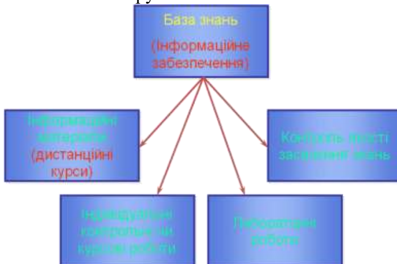
Рис.4 - Складові інформаційного забезпечення ІСДН

Обрані таким чином дисципліни визначають навчальне навантаження кафедр і конкретного викладача, яке розраховується до початку навчального семестру.